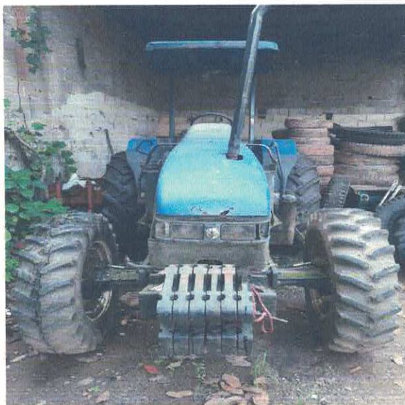
TRATOR AGRÍCOLA NEW HOLLAND 02