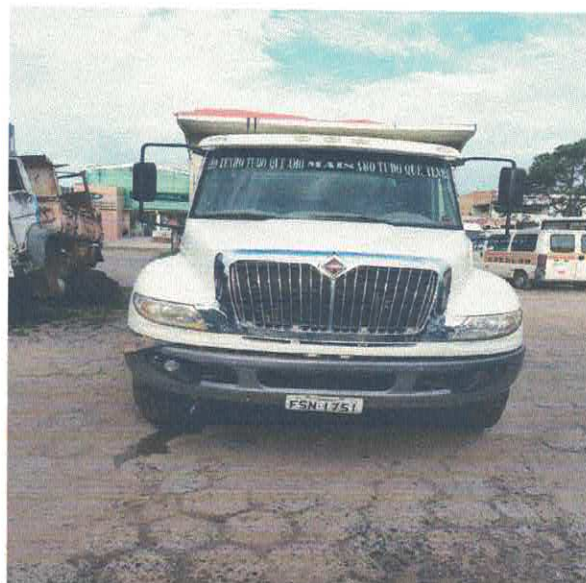
CAMINHÃO CAÇAMBA INTERNACIONAL FSN- 1751