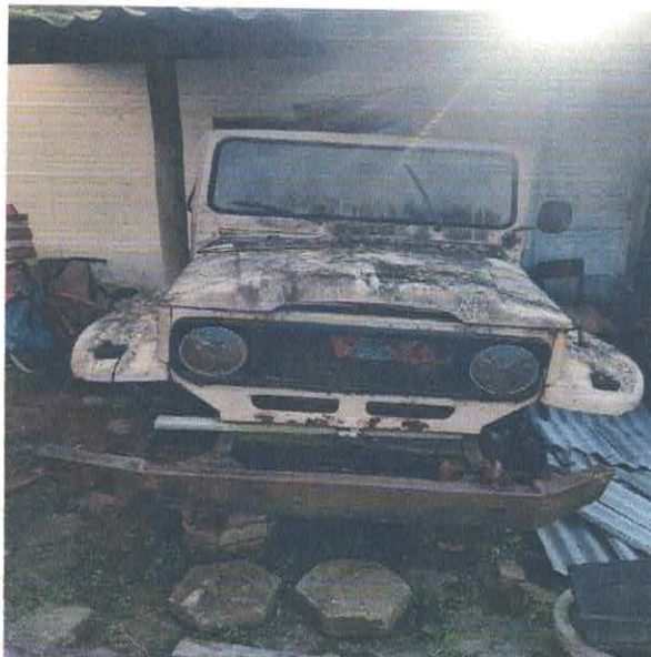
JEEP TOYOTA BPY-4403

Estado de São Paulo Rua Nossa Senhora do Monte Serrat, 133 – centro - Itariri /SP - CEP: 11.760-000 Telefax: (13) 3418-7300 Site: www.itariri.sp.gov.br E mail: prefeitura@itariri.sp.gov.br