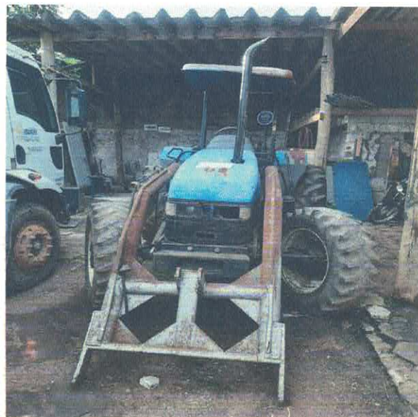
TRATOR AGRÍCOLA NEW HOLLAND 01