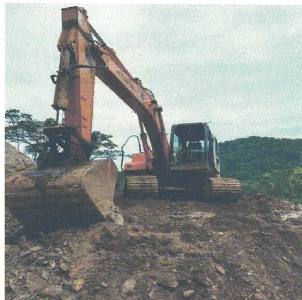
ESCAVADEIRA DE ESTEIRAS HYUNDAI