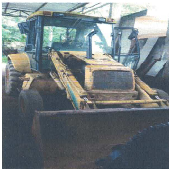
RETROESCAVADEIRA FIAT ALLIS