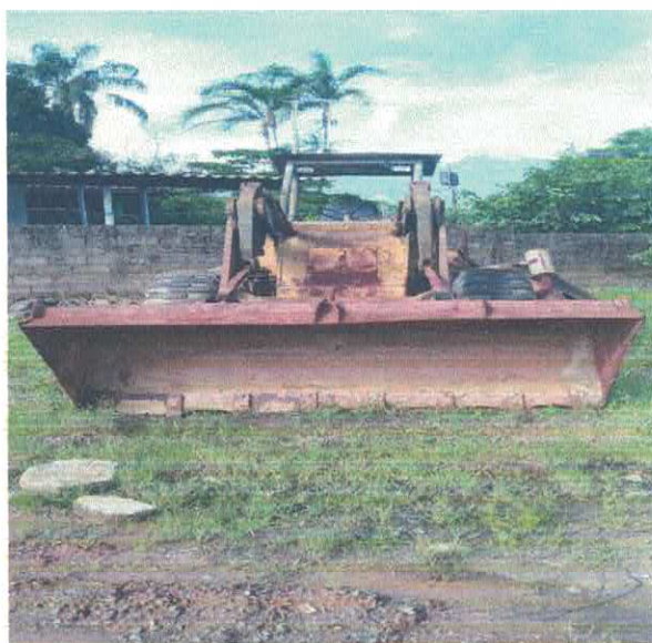
PÁ CARRAGADEIRA MICHIGAN