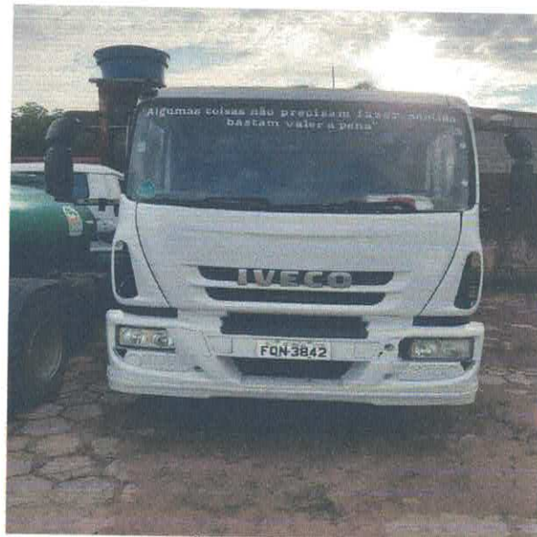
CAMINHÃO COLETOR FQN-3842