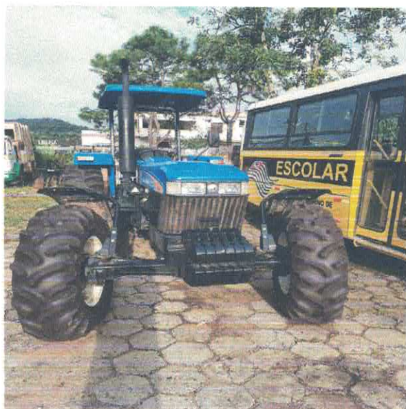
TRATOR AGRÍCOLA NEW HOLLAND

Estado de São Paulo Rua Nossa Senhora do Monte Serrat, 133 – centro - Itariri /SP - CEP: 11.760-000 Telefax: (13) 3418-7300 Site: www.itariri.sp.gov.br E mail: prefeitura@itariri.sp.gov.br