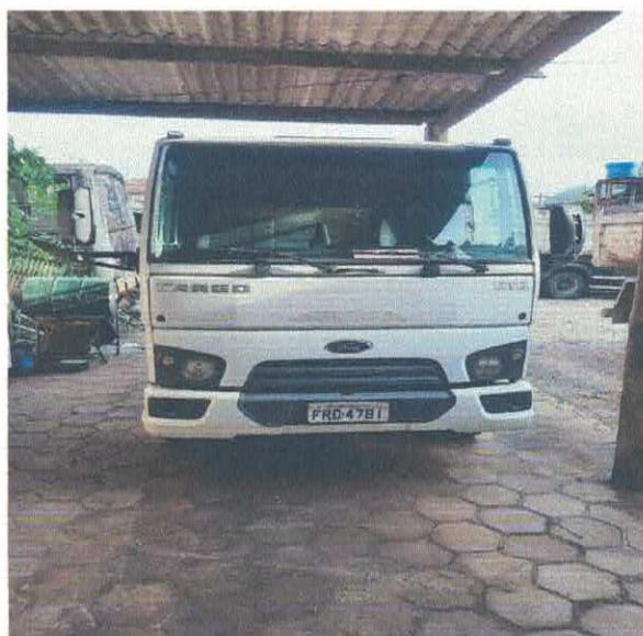
CAMINHÃO CARROCERIA FORD FRD-4781