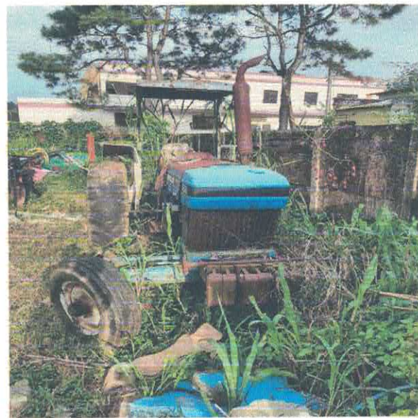
TRATOR AGRÍCOLA FORD NEW HOLLAND