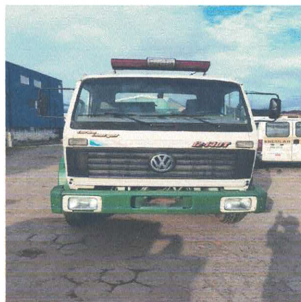
CAMINHÃO TAMQUE VOLKSWAGEN OZA-3226