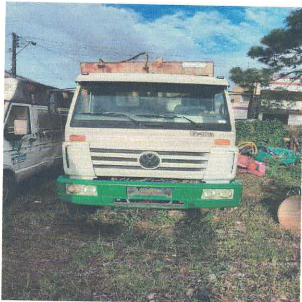
CAMINHÃO COLETOR CZA-3241

Estado de São Paulo Rua Nossa Senhora do Monte Serrat, 133 – centro - Itariri /SP - CEP: 11.760-000 Telefax: (13) 3418-7300 Site: www.itariri.sp.gov.br E mail: prefeitura@itariri.sp.gov.br