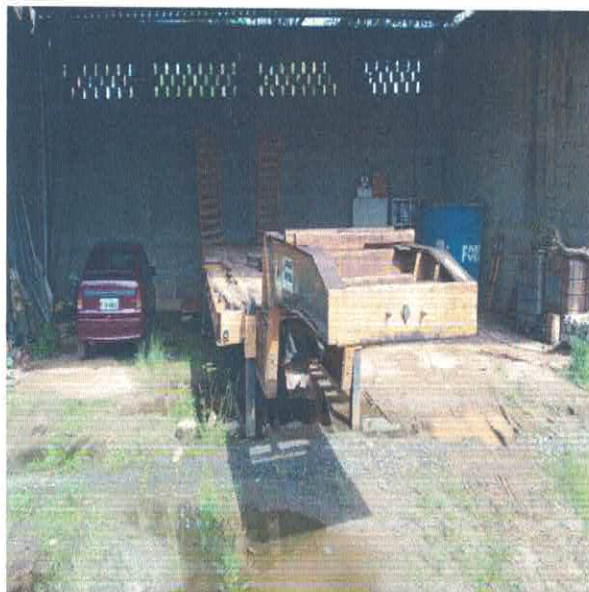
PRANCHA TRANSPORTADORA DBS-4549

Veículos e equipamentos lotados no Dpto. de Infraestrutura, Serviços Urbanos e Rurais e Agropecuária.