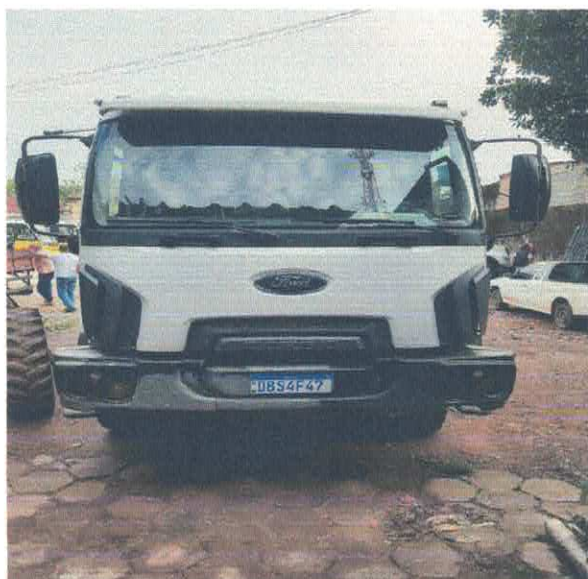
CAMINHÃO CAÇAMBA FORD DBS-4F47