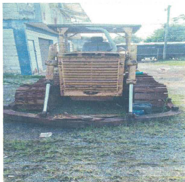
TRATOR DE ESTEIRAS KOMATSU D30