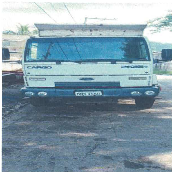
CAMINHÃO CAÇAMBA FORD DBS- 4550

Site: www.itariri.sp.gov.br E mail: prefeitura@itariri.sp.gov.br