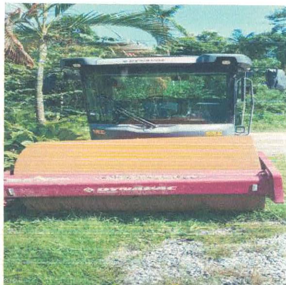
ROLO COMPACTADOR DYNAPAC