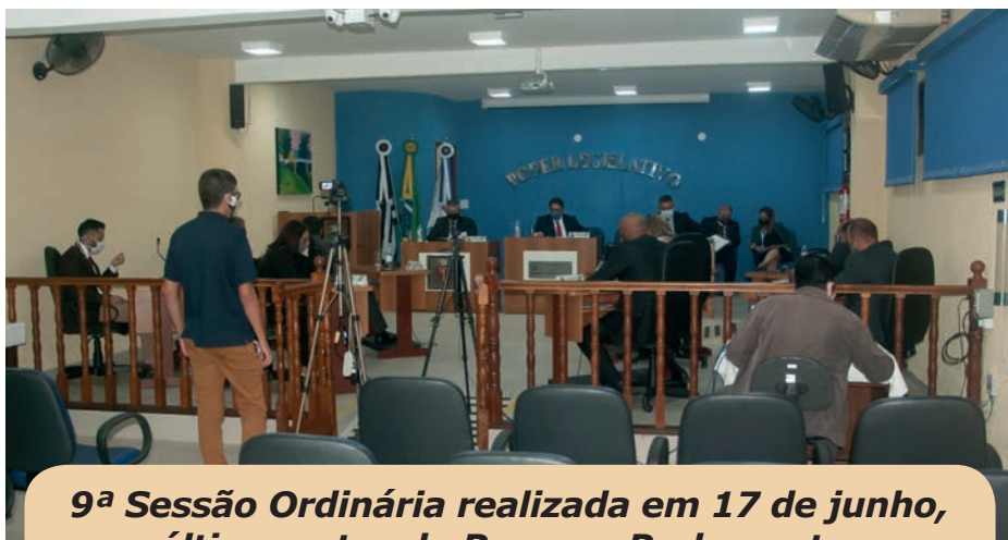
9ª Sessão Ordinária realizada em 17 de junho, última antes do Recesso Parlamentar

A Câmara Municipal entrou em recesso parlamentar no mês de julho: assim como ocorre nas esferas legislativas estadual e federal, a Casa tem as reuniões ordinárias suspensas durante todo o mês – a próxima sessão será realizada na quarta-feira 5 de agosto. No entanto, apesar de não haverem sessões, os demais trabalhos dos vereadores e da instituição continuam ocorrendo.